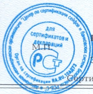
Схема сертификации - 1с